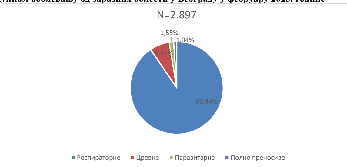
Графикон бр. 1. Процентуална заступљеност појединих група болести у укупном оболевању од заразних болести у Београду у фебруару 2025. године

У фебруару 2025. године доминирале су респираторне заразне болести (90,44%), пре свега због великог броја пријављених оболелих од Pharyngitis streptococcica , Influenzae , Varicellae , Tonsillitis streptococcica и Pneumoniae , а затим следе цревне заразне болести (6,87%), паразитарне (1,55%) и полно преносиве заразне болести (1,04%). Заступљеност појединих група заразних болести у структури оболевања од свих заразних болести у Београду регистрованих током фебруара приказана је на графикону бр. 1.