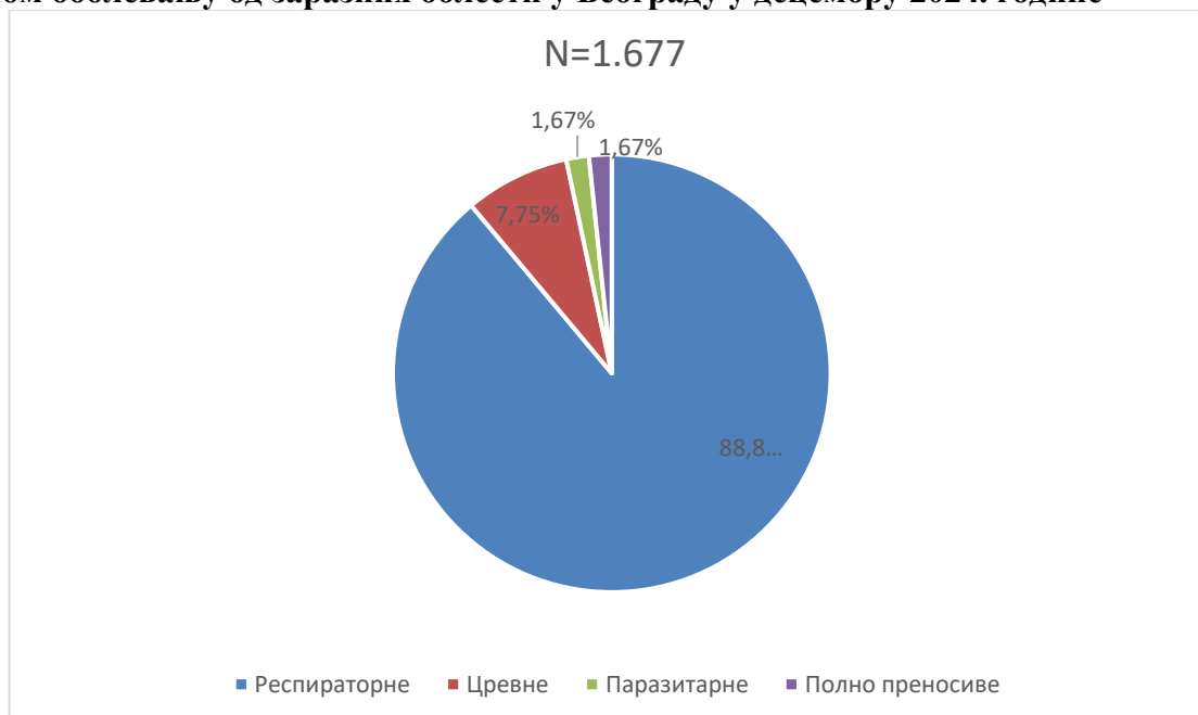
Графикон бр. 1. Процентуална заступљеност појединих група болести у укупном оболевању од заразних болести у Београду у децембру 2024. године

У децембру 2024. године доминирале су респираторне заразне болести (88,85%), пре свега због великог броја пријављених оболелих од Varicellae , Pharyngitis streptococcica , Tonsillitis streptococcica , Influenzae и Pneumoniae , а затим следе цревне заразне болести (7,75%), паразитарне и полно преносиве заразне болести (по 1,67%). Заступљеност појединих група заразних болести у структури оболевања од свих заразних болести у Београду регистрованих током децембра приказана је на графикону бр. 1.