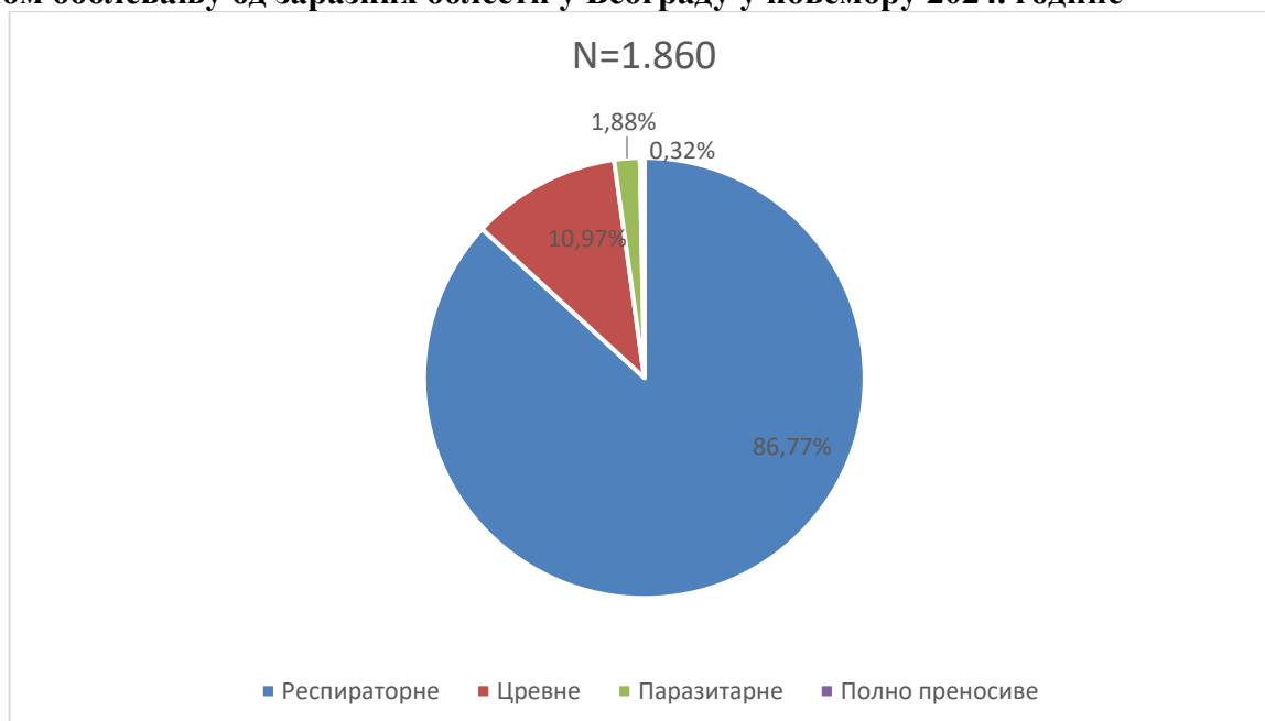
Графикон бр. 1. Процентуална заступљеност појединих група болести у укупном оболевању од заразних болести у Београду у новембру 2024. године

У новембру 2024. године доминирале су респираторне заразне болести (86,77%), пре свега због великог броја пријављених оболелих од Varicellae , Pharyngitis streptococcica , Tonsillitis streptococcica , Influenzae и Pneumoniae , а затим следе цревне заразне болести (13,12%), паразитарне (1,88%) и полно преносиве заразне болести (0,32%). Заступљеност појединих група заразних болести у структури оболевања од свих заразних болести у Београду регистрованих током новембра приказана је на графикону бр. 1.