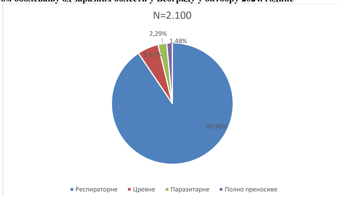
Графикон бр. 1. Процентуална заступљеност појединих група болести у укупном оболевању од заразних болести у Београду у октобру 2024. године

У октобру 2024. године доминирале су респираторне заразне болести (90,48%), пре свега због великог броја пријављених оболелих од Pharyngitis streptococcica , Varicellae , Tonsillitis streptococcica , Pneumoniae , Influenzae и COVID-19 , а затим следе цревне заразне болести (5,62%), паразитарне (2,29%) и полно преносиве заразне болести (1,48%). Заступљеност појединих група заразних болести у структури оболевања од свих заразних болести у Београду регистрованих током октобра приказана је на графикону бр. 1.