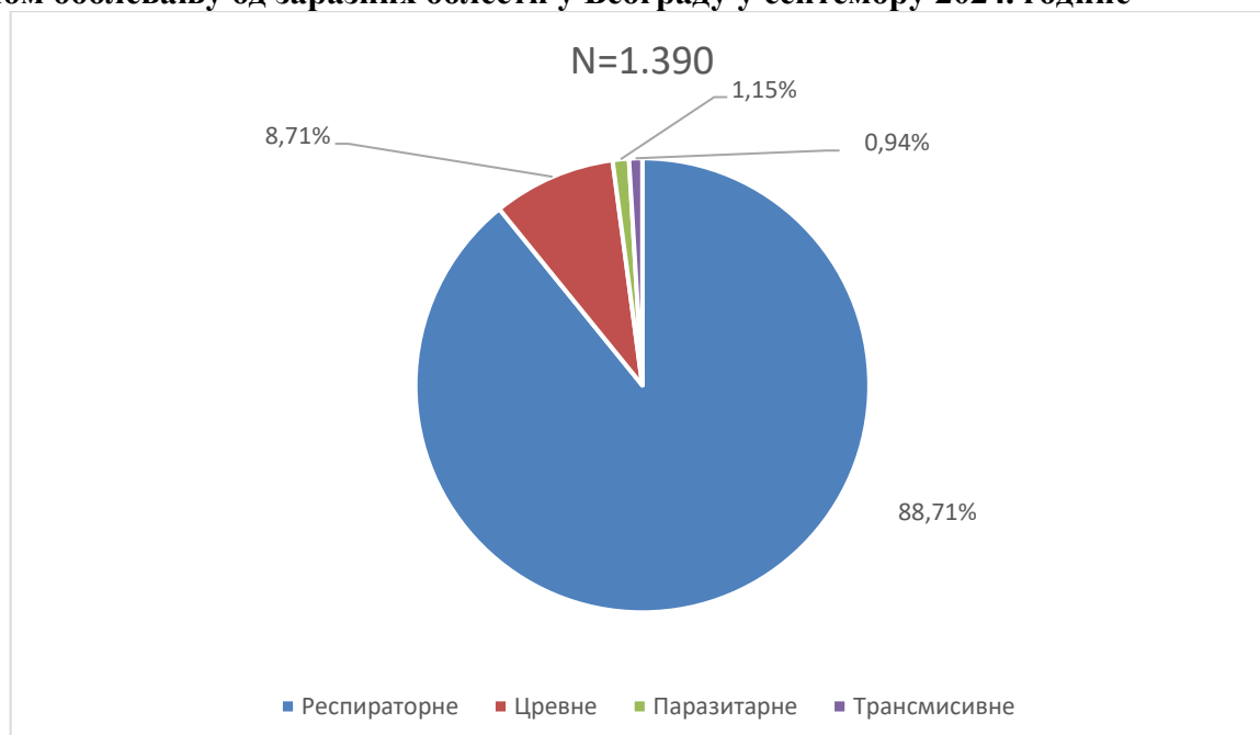
Графикон бр. 1. Процентуална заступљеност појединих група болести у укупном оболевању од заразних болести у Београду у септембру 2024. године

У септембру 2024. године доминирале су респираторне заразне болести (88,71%), пре свега због великог броја пријављених оболелих од Pharyngitis streptococcica , Varicellae , Tonsillitis streptococcica , COVID-19 , Influenzae и Pneumoniae , а затим следе цревне заразне болести (5,71%), паразитарне (1,15%) и трансмисивне заразне болести (0,94%). Заступљеност појединих група заразних болести у структури оболевања од свих заразних болести у Београду регистрованих током септембра приказана је на графикону бр. 1.