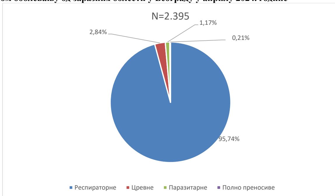
Графикон бр. 1. Процентуална заступљеност појединих група болести у укупном оболевању од заразних болести у Београду у априлу 2024. године

Заступљеност појединих група заразних болести у структури оболевања од свих заразних болести у Београду регистрованих током априла приказана је на графикону бр. 1.